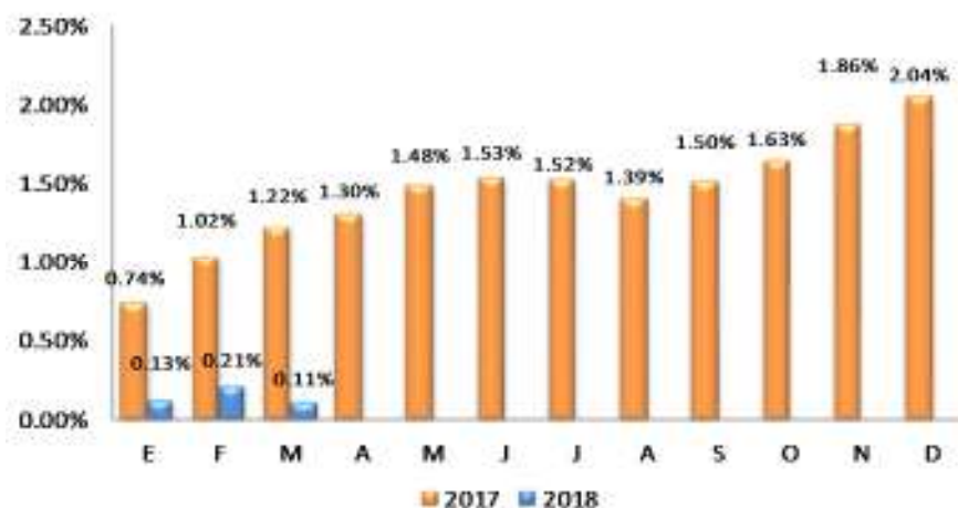
GRÁFICO 2 EL SALVADOR: VARIACIÓN PORCENTUAL ACUMULADA DEL IPC GENERAL, POR AÑO 2017 – 2018