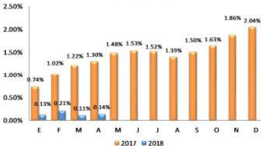
GRÁFICO 2 EL SALVADOR: VARIACIÓN PORCENTUAL ACUMULADA DEL IPC GENERAL, POR AÑO 2017 – 2018