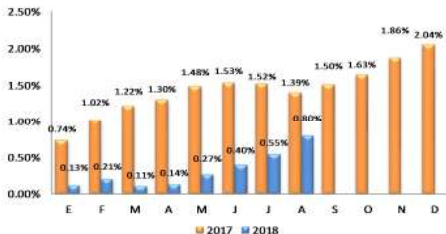
GRÁFICO 2 EL SALVADOR: VARIACIÓN PORCENTUAL ACUMULADA DEL IPC GENERAL, POR AÑO 2017 – 2018