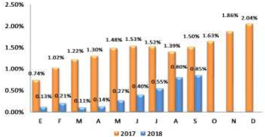
GRÁFICO 2 EL SALVADOR: VARIACIÓN PORCENTUAL ACUMULADA DEL IPC GENERAL, POR AÑO 2017 – 2018