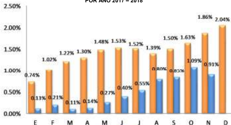
GRÁFICO 2 EL SALVADOR: VARIACIÓN PORCENTUAL ACUMULADA DEL IPC GENERAL, POR AÑO 2017 – 2018