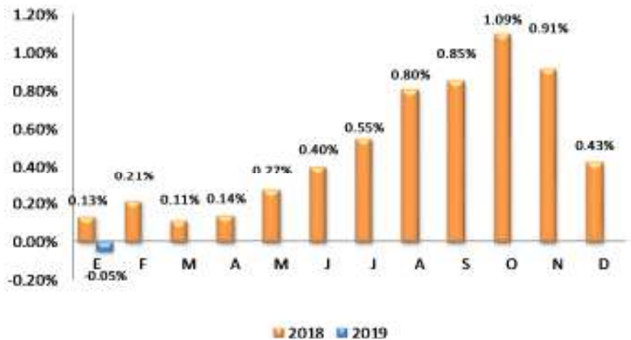
GRÁFICO 2 EL SALVADOR: VARIACIÓN PORCENTUAL ACUMULADA DEL IPC GENERAL, POR AÑO 2018 – 2019