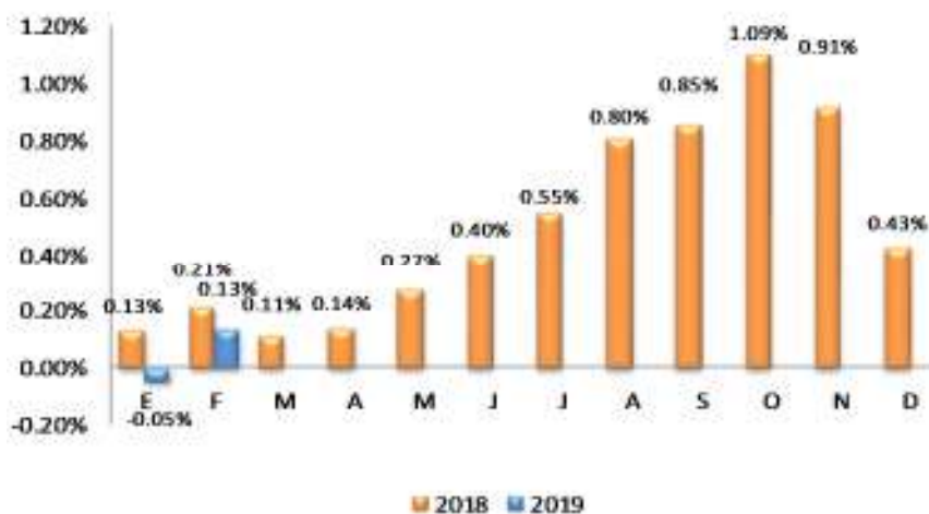
GRÁFICO 2 EL SALVADOR: VARIACIÓN PORCENTUAL ACUMULADA DEL IPC GENERAL, POR AÑO 2018 – 2019