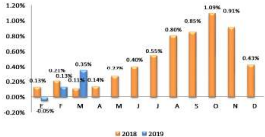
GRÁFICO 2 EL SALVADOR: VARIACIÓN PORCENTUAL ACUMULADA DEL IPC GENERAL, POR AÑO 2018 – 2019