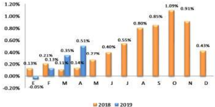
GRÁFICO 2 EL SALVADOR: VARIACIÓN PORCENTUAL ACUMULADA DEL IPC GENERAL, POR AÑO 2018 – 2019