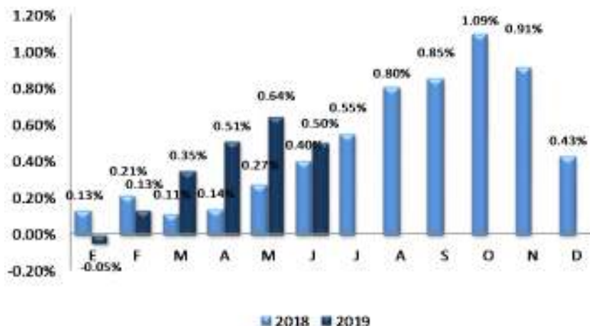
GRÁFICO 2 EL SALVADOR: VARIACIÓN PORCENTUAL ACUMULADA DEL IPC GENERAL, POR AÑO 2018 – 2019

En el gráfico 2, se muestra el comportamiento acumulado mensual del IPC para el año 2018 y 2019, en el cual se observa un aumento de 0.10 puntos porcentuales en 2019, al pasar el índice de 0.40% en junio 2018 a 0.50% en junio 2019, motivado por un mayor ritmo de variación en los precios en general, lo cual contribuye a mantener un nivel de inflación relativamente superior al registrado en junio 2018.