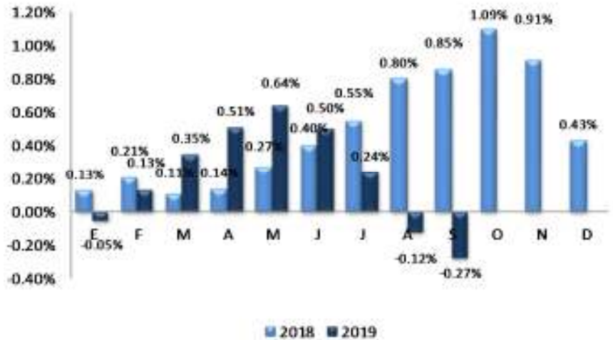
GRÁFICO 2 EL SALVADOR: VARIACIÓN PORCENTUAL ACUMULADA DEL IPC GENERAL, POR AÑO 2018 – 2019

En el gráfico 2, se muestra el comportamiento acumulado mensual del IPC para el año 2018 y 2019, en el cual se observa una disminución de 1.12 puntos porcentuales en 2019, al pasar el índice de 0.85% en septiembre 2018 a -0.27% en septiembre 2019, motivado por un menor ritmo de variación en los precios en general, lo cual contribuye a mantener un nivel de inflación relativamente inferior al registrado en septiembre 2018.