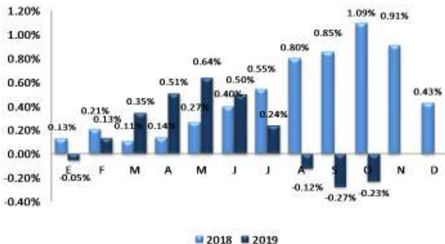
GRÁFICO 2 EL SALVADOR: VARIACIÓN PORCENTUAL ACUMULADA DEL IPC GENERAL, POR AÑO 2018 – 2019

En el gráfico 2, se muestra el comportamiento acumulado mensual del IPC para el año 2018 y 2019, en el cual se observa una disminución de 1.32 puntos porcentuales en 2019, al pasar el índice de 1.09% en octubre 2018 a -0.23% en octubre 2019, motivado por un menor ritmo de variación en los precios en general, lo cual contribuye a mantener un nivel de inflación relativamente inferior al registrado en octubre 2018.