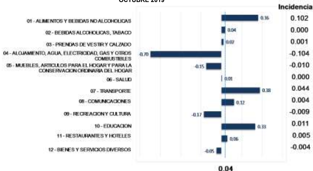
GRÁFICO 3 EL SALVADOR: VARIACIÓN PORCENTUAL MENSUAL E INCIDENCIA POR DIVISIONES, OCTUBRE 2019