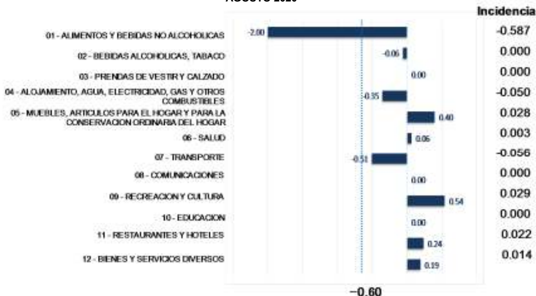
GRÁFICO 3 EL SALVADOR: VARIACIÓN PORCENTUAL MENSUAL E INCIDENCIA POR DIVISIONES, AGOSTO 2020